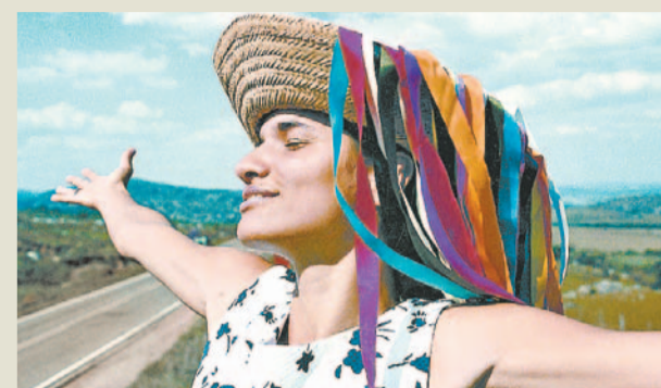
MARCELO OLIVEIRA/DIVULGAÇÃO - 12/9/06