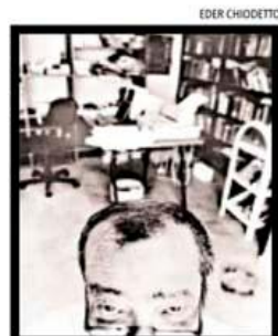
João Ubaldo