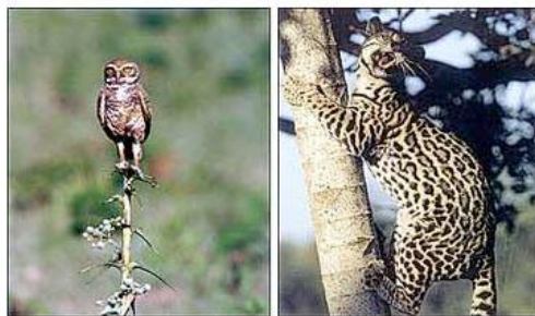
Coruja-buraqueira - Jaguaritica

Hoje – Dia Mundial da Fotografia – a partir das 19h, Araquém Alcântara vai estar no Museu Histórico Abílio Barreto, no projeto Foto em Pauta, falando do seu trabalho e autografando seus livros. "Luto para passar a mensagem de que não se deve banalizar a linguagem fotográfica", afirma. Um dica de como fotografar? "É preciso estar concentrado, como se não houvesse outra coisa senão você e o que você está fotografando. E de tanto castigar os olhos, numa fração de segundo, acontece a integração entre o seu ser e a coisa fotografada. É nestes momentos que você capta a real grandeza das coisas", ensina.